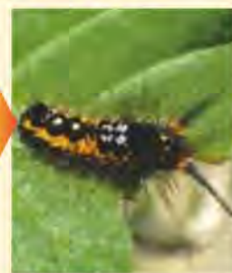
処理3日後 (日本農業(株)総合研究所)