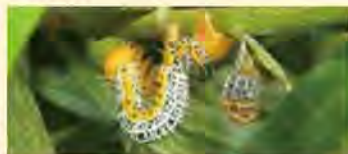
キオビエダシャク