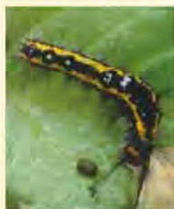
ロックオン1,000倍処理前