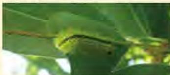
ヒロヘリアオイラガ